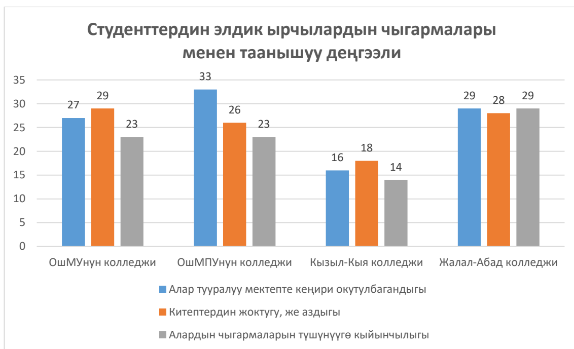
Диаграмма 2.2.2. – Студенттердин элдик ырчылардын чыгармалары менен таанышуу деңгээлинин төмөн болушунун негизги себептери ( пайыздык көрсөткүч)

Андан кийинки негизги милдет колледждерде акындар поэзиясын окутуунун усулун изилдөө жана биз иштеп чыккан усулдук ыкмаларды, сабактардын моделдерин, сунуштарыбызды колледждердеги эксперимент жүргүзө турган окутуучулар менен талкуулоо болду. Мисалы, биз чыгармаларды окутууда КАМК-талдоону, мозаика, элдик ишенимдер менен тыйымдарды, макал-лакаптарды колдонуу ыкмаларын пайдаландык. Аларды Тоголок Молдонун «Жер жана анын балдары» чыгармасын эксперименталдык топтордо окутууда колдонуу технологияларын диссертацияда көрсөттүк. Ошондой эле эксперименталдык топтордо колледждерде акындар чыгармачылыгын окутууда тексттен этнопедагогикалык идеяларды табуу, текст менен иштөө, тексти интерпретациялоо, сөздүк иштерин жүргүзүү, идеялар жарышына даярдануу, ой толгоолор топтомун даярдоо, чыгармалардан элдик философиянын жана элдик тарбиянын элементтерин табуу ыкмалары колдонулду.